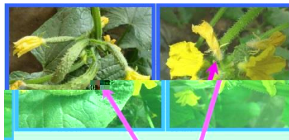
黄瓜的花有雌花和雄花之别。